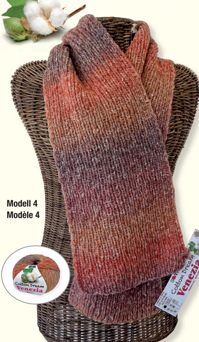
Modell 4 Modèle 4